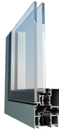
Icon 70 BV